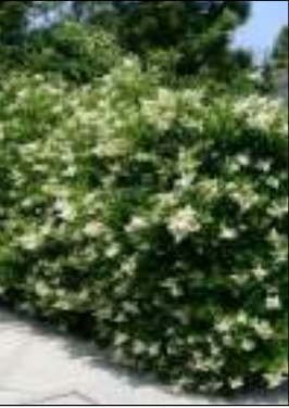
Ligustro - Ligustrum Japonicum