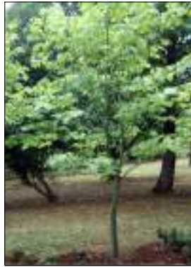
Acero - Acer Pensylvanicum