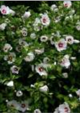
Ibisco - Hibiscus Syriacus