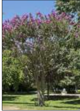
Lagestroemia - Lagestroemia Indica