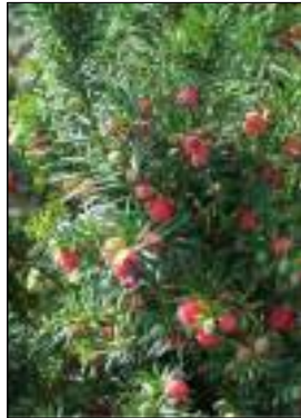
Tasso - Taxus Baccata