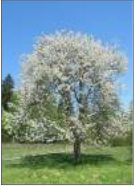
Ciliegio - Prunus Avium