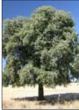
Leccio - Quercus ilex