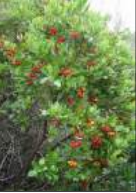
Corbezzolo - Arbustus Uhedo