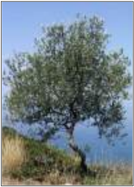
Ulivo - Olea Europaea