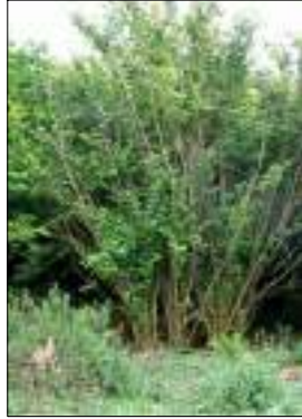
Nocciolo - Corilus Avellana