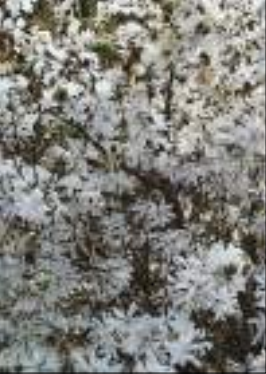
Magnolia stellata - Magnolia Stellata