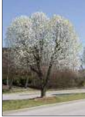
Pero da fiore - Pyrus Calleryana