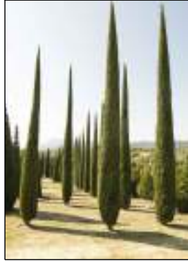
Cipresso - Cupressus Pyramidalis