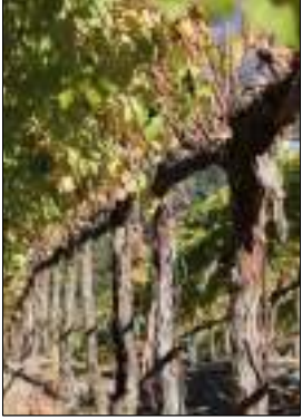
Vite - Vitis Vinifera