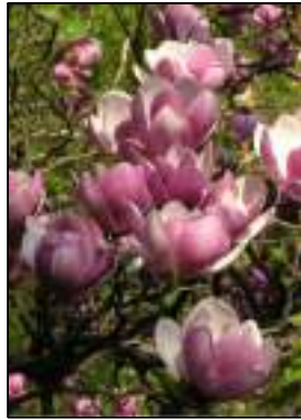
Magnolia a fiore- Magnolia Soulangiana