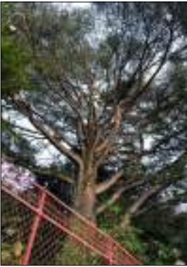
A - Cedro dell'Atlante Cedrus atlantica