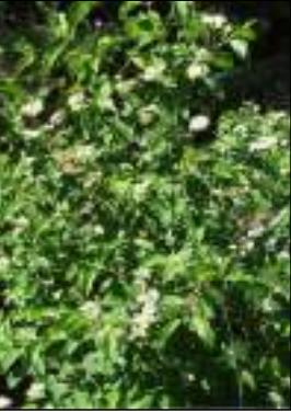
Sanguinella - Cornus sanguinea