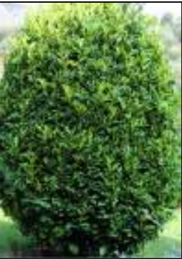
Alloro - Laurus nobilis