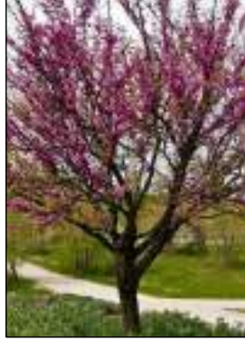
Albero di Giuda - Cercis Siliquastrum